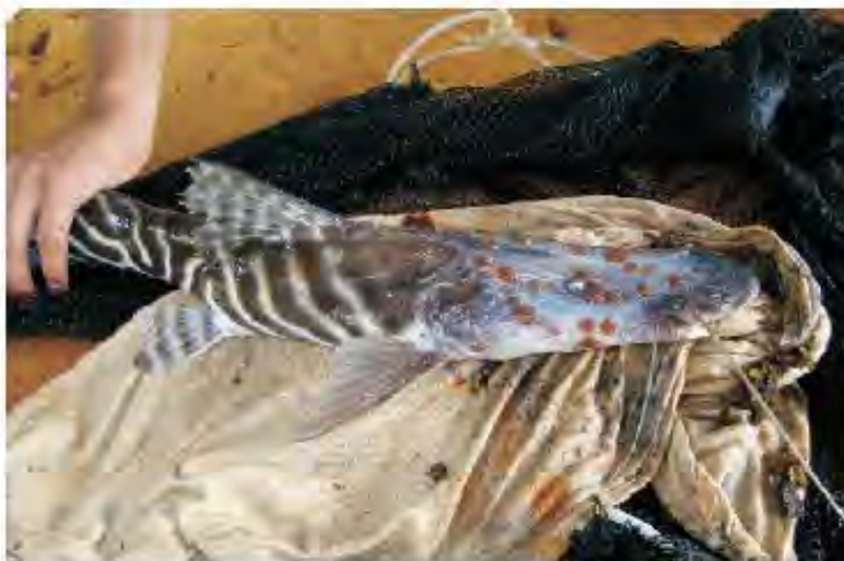
Figura 1. Argulus pestifer parasitando Brachyplatystoma tigrinum criado en estanque. Nótese la piel, de color blanquesino grisáceo erosionada en la región cefálica.

El parásito A. pestifer alcanza un tamaño de 17 mm de longitud por 14 mm de ancho, tiene una forma aplanada y, en la región ventral, presenta una serie de estructuras que le permiten la fijación al hospedador, entre ellas, las ventosas, los apéndices bucales y las patas, provistas de largas uñas (Figura 2).