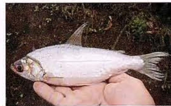
19 Potamorhina altamazonica "Yambina" Familia CURIMATIDAE Migratoria - Micrófaga / Detritívora - 20 cm.