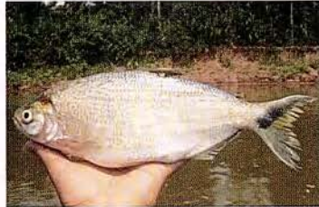
2 Brycon melanopterus "Sábalo cola negra" Familia CHARACIDAE Migratoria - Omnívora - 20 cm.