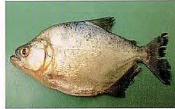
11 Serrasalmus rhombus "Paña" Familia CHARACIDAE Sedentaria - Omnívora - 20 cm.