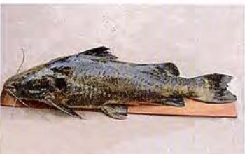
37 Zungaro zungaro "Zúngaro negro" Familia PIMELODIDAE Migratoria - Carnívora - 130 cm.