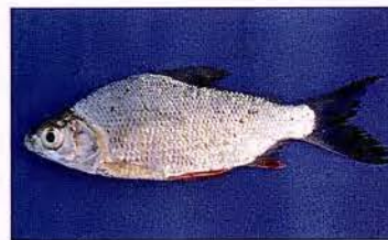
18 Curimata aspera "Yahuarachi" Familia CURIMATIDAE Migratoria - Micrófaga / Detritívora - 15 cm.