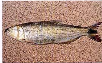
10 Salminus iquitensis "Sábalo macho" Familia CHARACIDAE Migratoria - Carnívora - 30 cm.