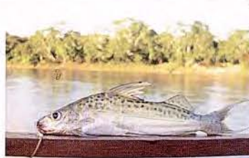
31 Pimelodus maculatus "Cunchi" Familia PIMELODIDAE Migratoria - Omnívora - 15 cm.