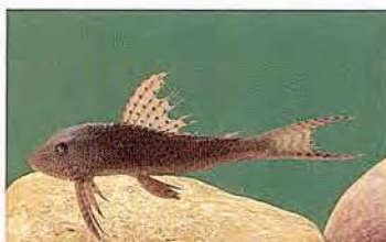
39 Aphanotorulus unicolor "Carachama" Familia LORICARIIDAE Sedentaria - Micrófaga / Detritívora - 10 cm.