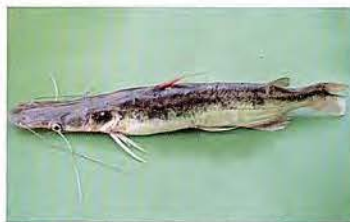
35 Sorubim lima "Shiripira" Familia PIMELODIDAE Migratoria - Carnívora - 40 cm.