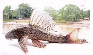
40 Hypostomus fonchii "Carachama" Familia PIMELODIDAE Sedentaria - Micrófaga / Detritívora - 20 cm.