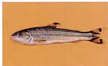
21 Leporellus vittatus "Lisa paucar" Familia ANOSTOMIDAE Migratoria - Omnívora - 20 cm.