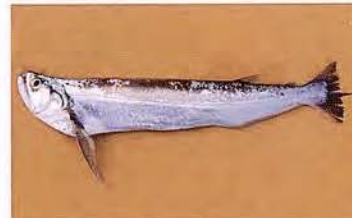
15 Rhaphiodon vulpinus "Chambira" Familia CYNODONTIDAE Migratoria - Piscívora - 40 cm.