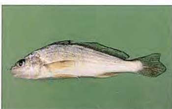
47 Pachypops fulcroi "Corvina" Familia SCIANIDAE Migratoria - Carnívora - 20 cm.