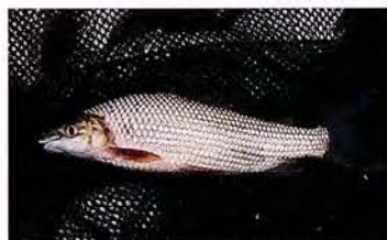
17 Prochilodus nigricans "Chupadora" Familia PROCHILODONTIDAE Migratoria - Micrófaga / Detritívora - 25 cm.