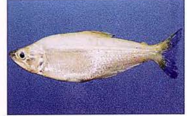
4 Galeocharax gulo "Denton" Familia CHARACIDAE Migratoria - Carnívora - 15 cm.