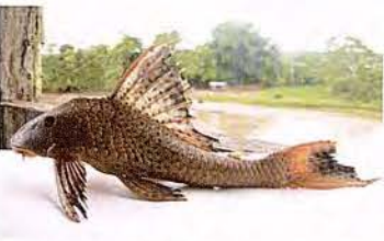
41 Hypostomus pyrineusi "Carachama" Familia LORICARIIDAE Sedentaria - Micrófaga / Detritívora - 20 cm.