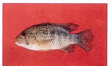
48 Tahuantinsuyoa chipi "Bujurqui" Familia CICHLIDAE Sedentaria - Omnívora - 10 cm.