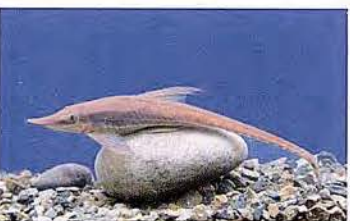
45 Sturisoma nigrirostrum "Carachama" Familia LORICARIIDAE Sedentaria - Micrófaga / Detritívora - 20 cm.