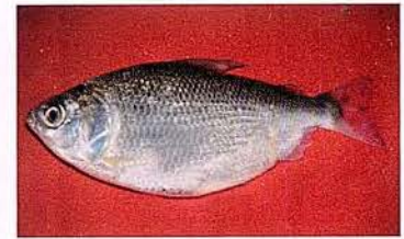
20 Psectrogaster amazonica "Chío chío" Familia CURIMATIDAE Migratoria - Micrófaga / Detritívora - 15 cm.