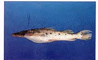
28 Hemisorubim platyrhynchos "Toa" Familia PIMELODIDAE Migratoria - Carnívora - 40 cm.