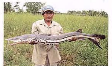
36 Sorubimichthys planiceps "Achacubo" Familia PIMELODIDAE Migratoria - Carnívora - 120 cm.