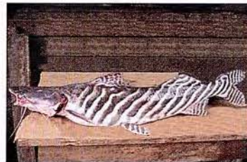
27 Brachyplatystoma tigrinum "Zebra" Familia PIMELODIDAE Migratoria - Piscívora - 90 cm.