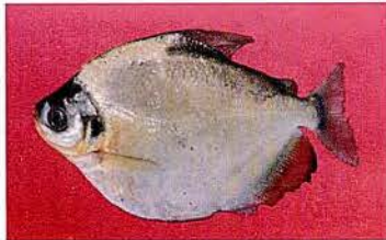
5 Mylossoma aureum "Palometa" Familia CHARACIDAE Migratoria - Frugívora - 20 cm.