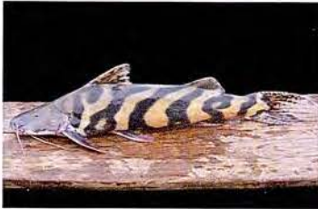
25 Brachyplatystoma juruense "Achuni zúngaro" Familia PIMELODIDAE Migratoria - Alimentación Piscívora - Talla promedio 70 cm.