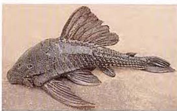
43 Panaque sp. "Carachama" Familia LORICARIIDAE Sedentaria - Alimentación madera - 20 cm.