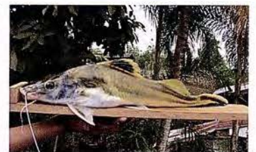
32 Pimelodus ornatus "Cunchi" Familia PIMELODIDAE Migratoria - Omnívora - 25 cm.