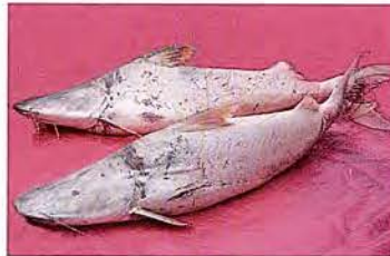
26 Brachyplatystoma rousseauxii "Dorado" Familia PIMELODIDAE Migratoria - Piscívora - 100 cm.