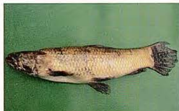
13 Hoplias malabaricus "Huasaco" Familia ERYTHRINIDAE Sedentaria - Carnívora - 25 cm.