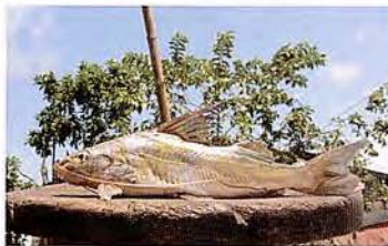
30 Pimelodus blochii "Cunchi" Familia PIMELODIDAE Migratoria - Omnívora - 15 cm.