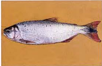
1 Brycon amazonicus "Sábalo cola roja" Familia CHARACIDAE Migratoria - Alimentación Omnívora - Talla promedio 40 cm.