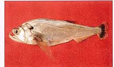
16 Hydrolicus scomberoides "Chambira" Familia CYNODONTIDAE Migratoria - Piscívora - 30 cm.