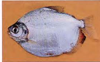
6 Mylossoma duriventre "Palometa" Familia CHARACIDAE Migratoria - Frugívora - 20 cm.