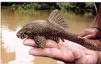
42 Lasiancistrus scomburgkii "Carachama" Familia LORICARIIDAE Sedentaria - Micrófaga / Detritívora - 15 cm.