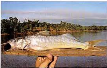
29 Megalonema platycephalum "Bagre" Familia PIMELODIDAE Migratoria - Carnívora - 30 cm.