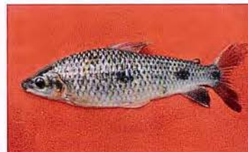
22 Leporinus friderici "Lisa" Familia ANOSTOMIDAE Migratoria - Omnívora - 20 cm.