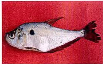
9 Roeboides myersii "Dentón" Familia CHARACIDAE Migratoria - Carnívora - 15 cm.