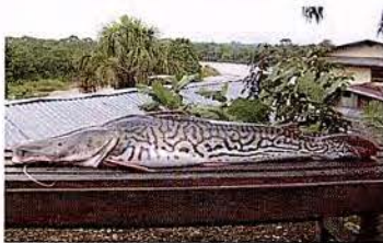
34 Pseudoplatystoma tigrinum "Puma zúngaro" Familia PIMELODIDAE Migratoria - Piscívora - 110 cm.