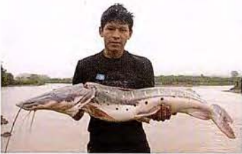
33 Pseudoplatystoma punctifer "Doncella" Familia PIMELODIDAE Migratoria - Carnívora - 100 cm.