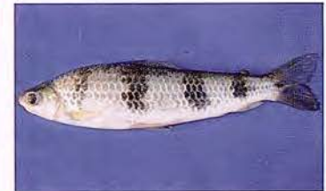
24 Schizodon fasciatus "Lisa" Familia ANOSTOMIDAE Migratoria - Herbívora - 25 cm.