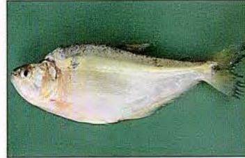
3 Charax tectifer "Denton" Familia CHARACIDAE Migratoria - Carnívora - 15 cm.