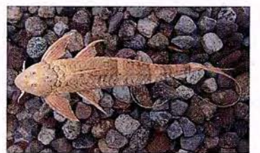
44 Spatuloricaria evansii "Carachama" Familia LORICARIIDAE Sedentaria - Micrófaga / Detritívora - 30 cm.