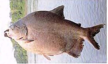
8 Piaractus brachipomus "Paco" Familia CHARACIDAE Migratoria - Omnívora - 40 cm.