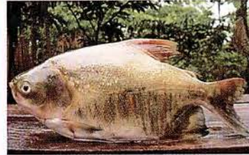
7 Colossoma macropomun "Gamitana" Familia CHARACIDAE Migratoria - Omnívora - 40 cm.