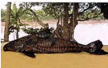
38 Oxydoras niger "Turushuqui" Familia DORADIDAE Migratoria - Detritívora / Carnívora - 70 cm.