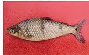
23 Leporinus trifasciatus "Lisa" Familia ANOSTOMIDAE Migratoria - Omnívora - 25 cm.