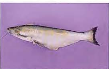
46 Auchenipterus nuchalis "Maparate" Familia AUCHENIPTERIDAE Migratoria - Carnívora - 15 cm.